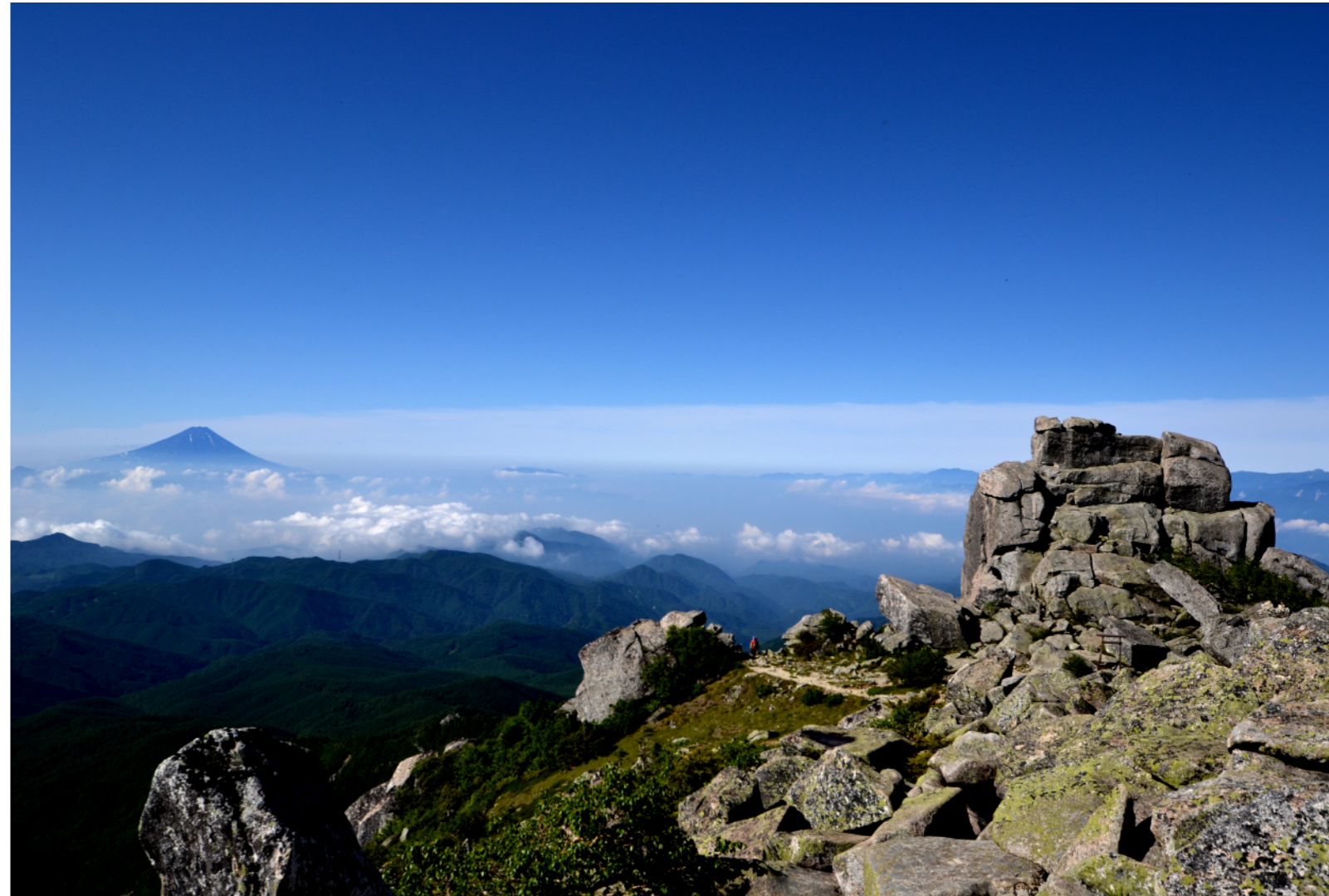
金峰山山頂から望む景色