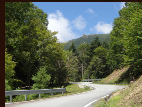
大弛峠へ続く川上牧丘林道