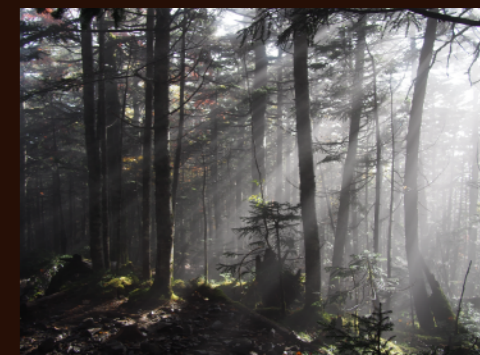
金峰山へ向かう登山道