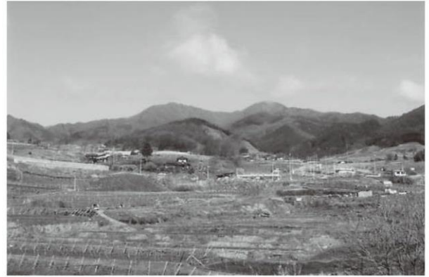
巨峰の里から大沢の峰（左）と小櫛山（右）を望む

山梨市役所観光課 0553-22-1111 栄和交通（焼山行きバス・完全予約制） 0553-26-2344 塩山タクシー 0553-32-3200 ※焼山行きバス時刻 （6 月 1 日～11 月 24 日の土日祝日のみ運行） 塩山駅北口発 7:30/8:30/9:30 ※2