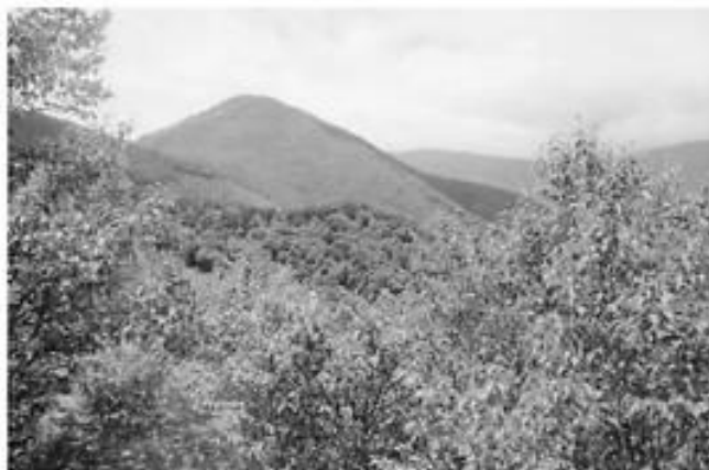
2021年春から黒金山を望む

西沢溪谷から黒金山に登り、牛首のタルから乾徳山林道に下り天科(あましな)に下った。ロングコースである。適当なバス便はなく、マイカーかタクシーを利用せざるを得ない。