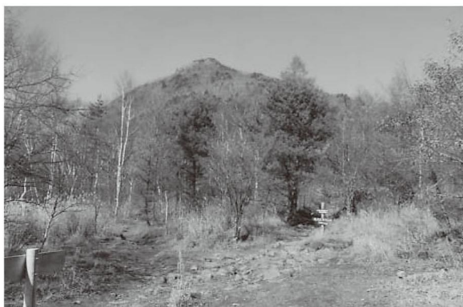
国師ヶ原十字路（背後は乾徳山）

山梨市役所総務課・観光協会 0553-22-1111 甲州タクシー山梨営業所 0553-22-1551 山梨貸切自動車 ※3（塩山＝登山口） 0553-33-3141 ※山梨市営バス時刻 山梨市駅発 9:12/10:21 乾徳山登山口発 15:36/16:51 ※山梨貸切自動車 ※3 時刻 塩山駅南口発 8:30/9:05 乾徳山登山口発 15:08/16:08