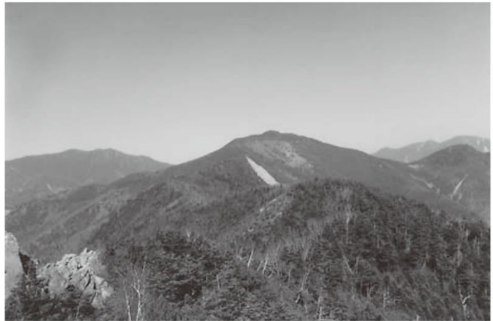
乾徳山山頂から黒金山方面を望む

う回下山路は、ガレ場が多いので、固定ロープを利用して下降する。最後のガレ場を横切り、しばらくしてカラマツ林に入り、西から南に巻いて高原ヒュッテに着く。国師ヶ原十字路に出て、ヒュッテ管理道を緩やかに登ると道満尾根の上に出る。