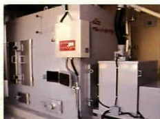
ペレットボイラー